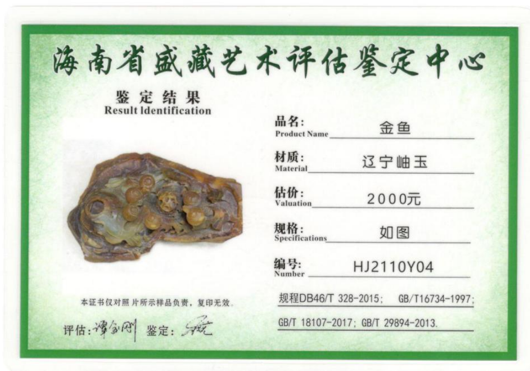
序号 4、石头-浅绿色，葡萄 壹个